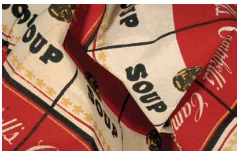
The Souper Dress: Aina Vamou, 2008.