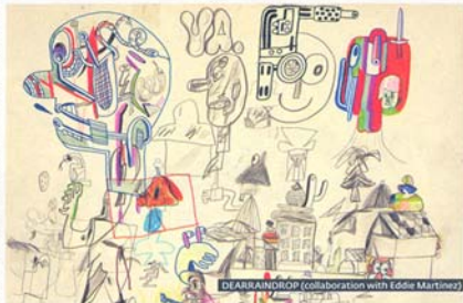
DEARRAINOROP (collaboration with Eddie Martinez)